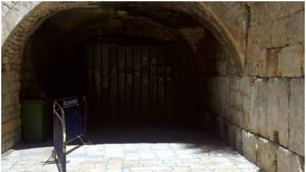
הכותל הקטן ומכלי האשפה בפניה השמאלית

בחודש מאי, הוגשה מחדש תוכנית בניה של שכונה יהודית באזור שער הפרחים שברובע המוסלמי. בשנים 2004-2005 התוכנית הוגשה לוועדות התכנון והבניה, אולם ההצעה נדחתה על ידי הוועדה המחוזית. התוכנית שהוגשה כללה בניית 21 יחידות דיור בשטח המוכר כבורג' אל-לקלק, בצמוד לחומות העיר העתיקה. 17 כרגע לא ברור אם ומתי ידונו בהצעה בוועדות התכנון המקומית והמחוזית. נראה שאם תתקבל החלטה לבנות באתר, השלב הראשון יהיה המשך החפירה הארכיאולוגית במקום.