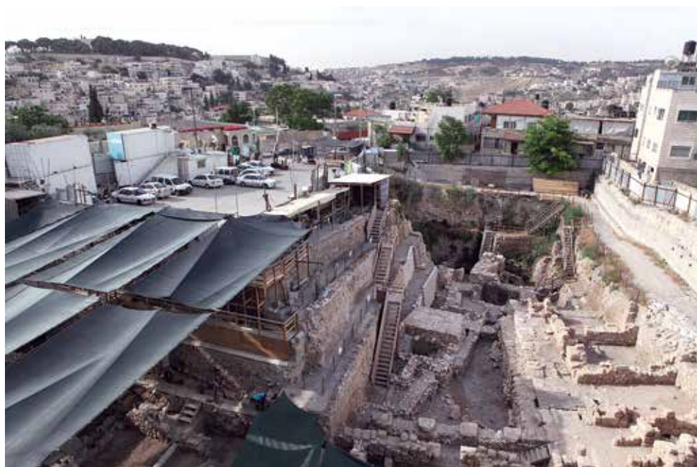
חפירות חניון גבעתי ובתי הכפר סילוואן