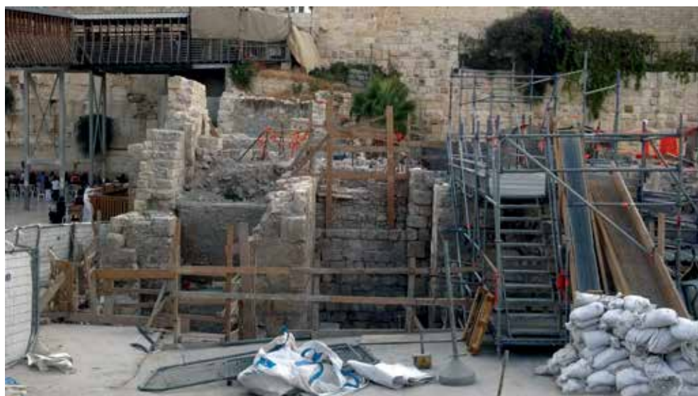
חפירות גשר המוגרבים - מבט מקרוב