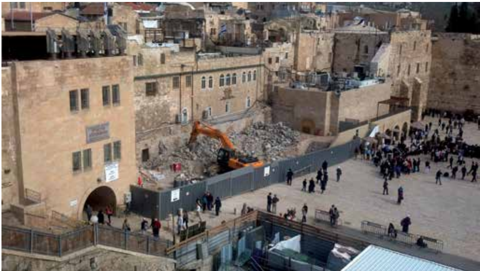
עבודות הריסה במתחם 'בית שטראוס'

הרחבה שנבנתה מהווה מעין פתרון זמני לתפילה מעורבת של נשים וגברים בכותל המערבי; אולם, גם כפתרון זמני היא יוצרת כמה עובדות מדאיגות בשטח: 1. היא מרחיבה את שטח התפילה לתוך האזור הארכיאולוגי ובכך קובעת תקדים: שטחי תפילה ניתנים להרחבה בלי להתחשב בשיקולים אזרחיים/חילוניים או ציבוריים אחרים, כדוגמת שימור של אתר העתיקות לציבור המבקרים ושוחרי ההיסטוריה. במקרה זה, הפגיעה היא במבנים, ובמניעת הצגת השרידים - לטובת קידום התפילה. זהו תקדים מסוכן, מכיוון שהוא מאפשר הרחבת שטחי תפילה במקומות שונים בעיר העתיקה (ראה למשל הפרק על הכותל הקטן, או המאבק לעליית יהודים להתפלל על הר הבית). 2. יש צורך לאזן בין האזורים המיועדים לתפילה והאזורים המיועדים להצגת תולדות העיר. איזון זה נדרש כדי למנוע התעצמות חריגה של השיקולים הדתיים על חשבון השיקולים ההיסטוריים. 3. הניסיון מלמד, שבניה זמנית בעיר העתיקה מהווה תקדים מסוכן: הזמני יכול לשרוד למשך זמן רב מאוד. המקרה הבולט ביותר לכך הוא גשר המוגרבים, שהוא גשר זמני אשר נבנה לאחר קריסת הגשר הקבוע בשנת 2004.