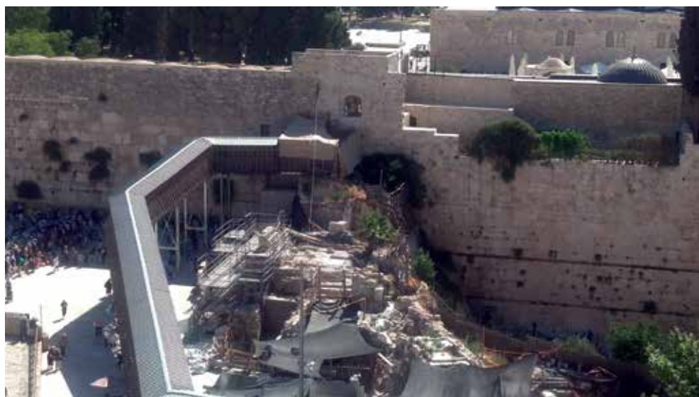
חפירות ארכיאולוגיות מתחת לגשר המוגרבים