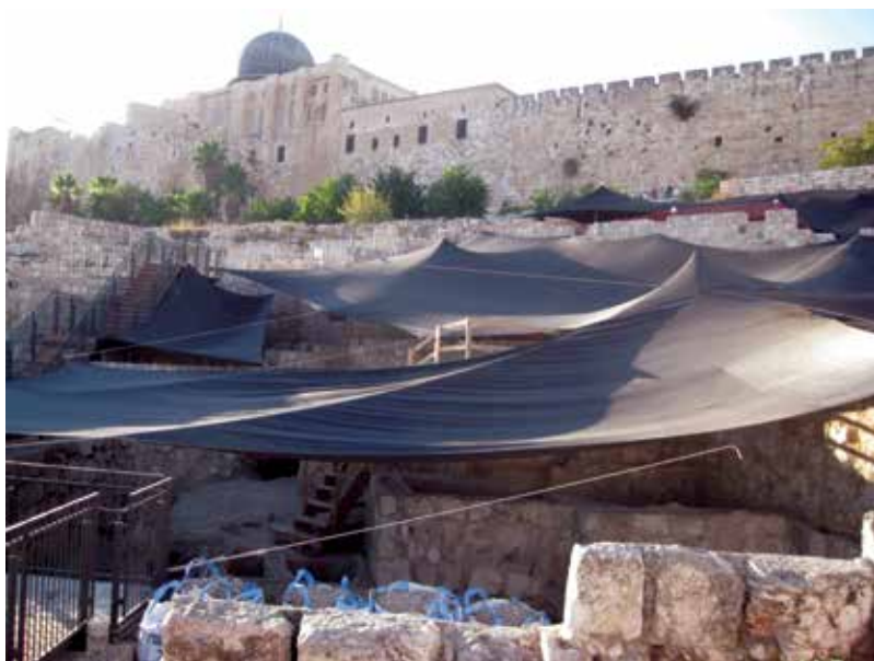
חפירות ועבודות שימור במזרח 'חפירות העופל'

חוקרים בריטיים וצרפתיים במאה ה-19 ערכו מיפוי של בורות המים הרבים שנחשפו בהר הבית/חארם א-שריף ובסביבתו. 9 בורות המים שנחשפו לאחרונה מסביב להר הבית/חארם אל-שריף, משתלבים היטב עם הידוע לנו ממחקרים אלה.