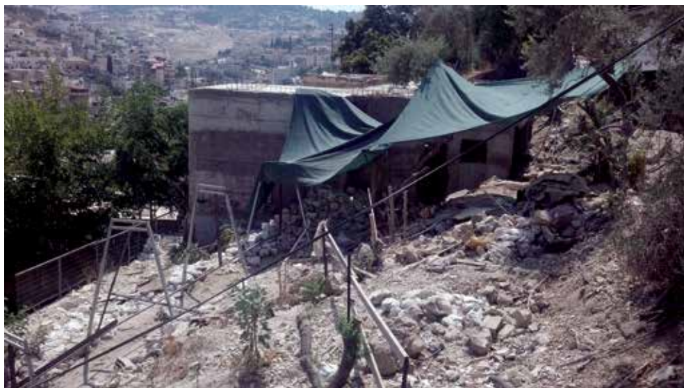
שטח החפירה בין פיר וורן לבית המעיין