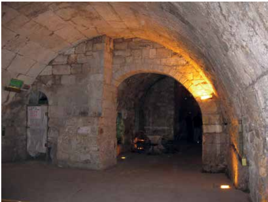
חלל במנהרות הכותל

החפירות הנערכות מתחת לרובע המוסלמי הם אחד הפרויקטים השאפתניים של ישראל בעיר העתיקה ומהמוכנים שבהם, מבחינה פוליטית. חפירות אלו יוצרות עיר תת קרקעית, המתעלמת מהאוכלוסייה הפלסטינית הגרה מעליה, יוצרת נרטיב יהודי-ישראלי בלעדי ומקשה על מציאת פתרון לחלוקת העיר העתיקה.