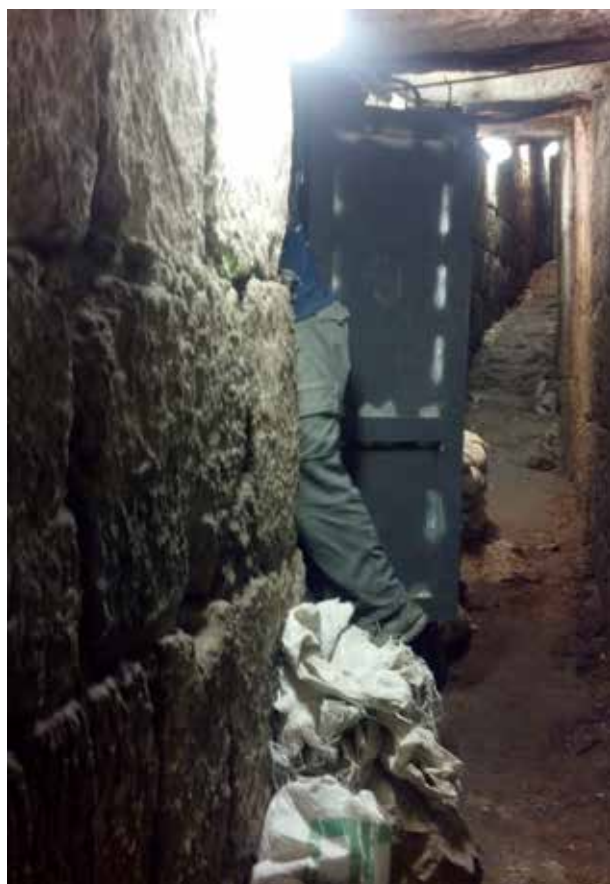
פתח המנהרה המערבית מתחת לבתי סילוואן