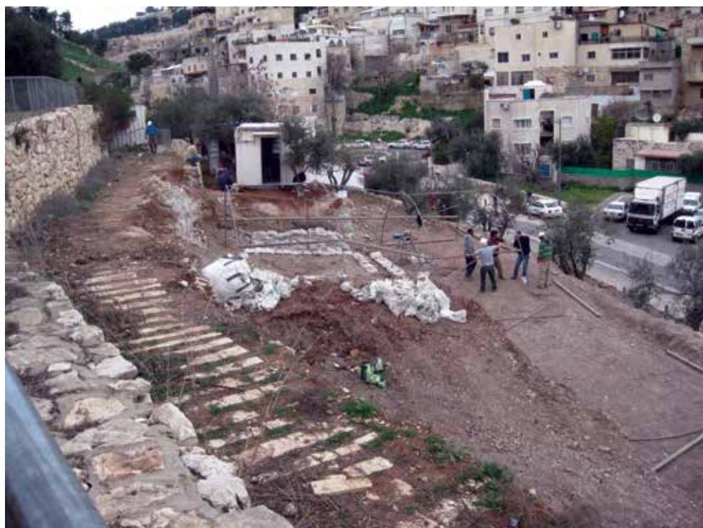
שטח החפירה של אוניברסיטת ת"א