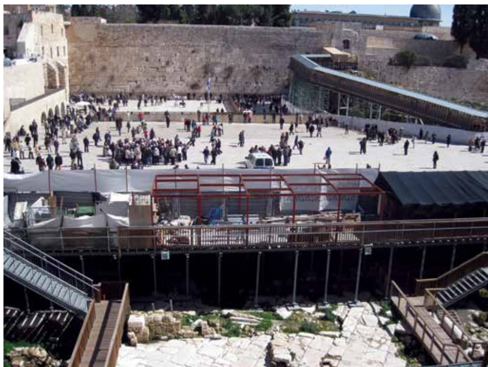
מבט על שרידי רחוב רומי שנחשף בחפירות בשטח המיועד לבית הליבה