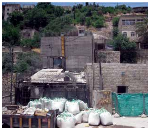
עבודות בבית המעיין