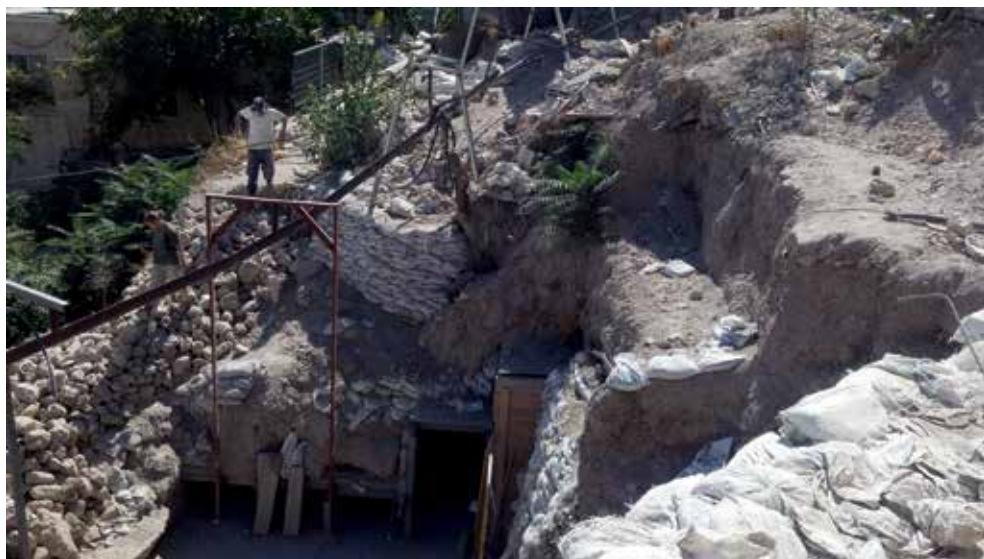
פתח שנחפר מבית המעיין לכיוון מערב