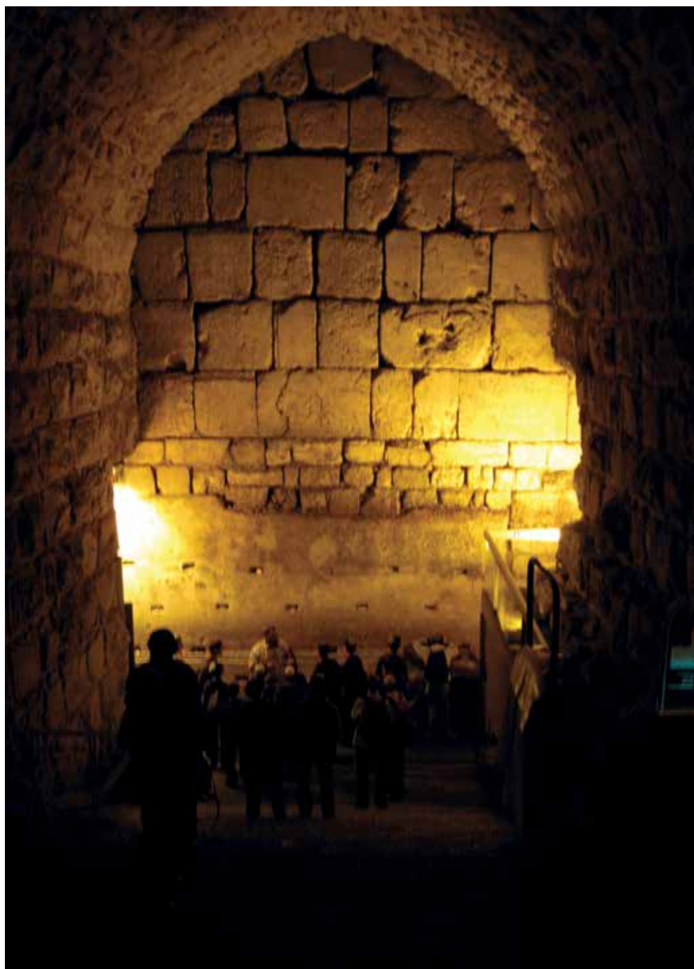
מבט על הכותל המערבי ממנהרות הכותל