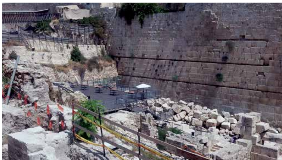
במת התפילה המיועדת ל'נשות הכותל'